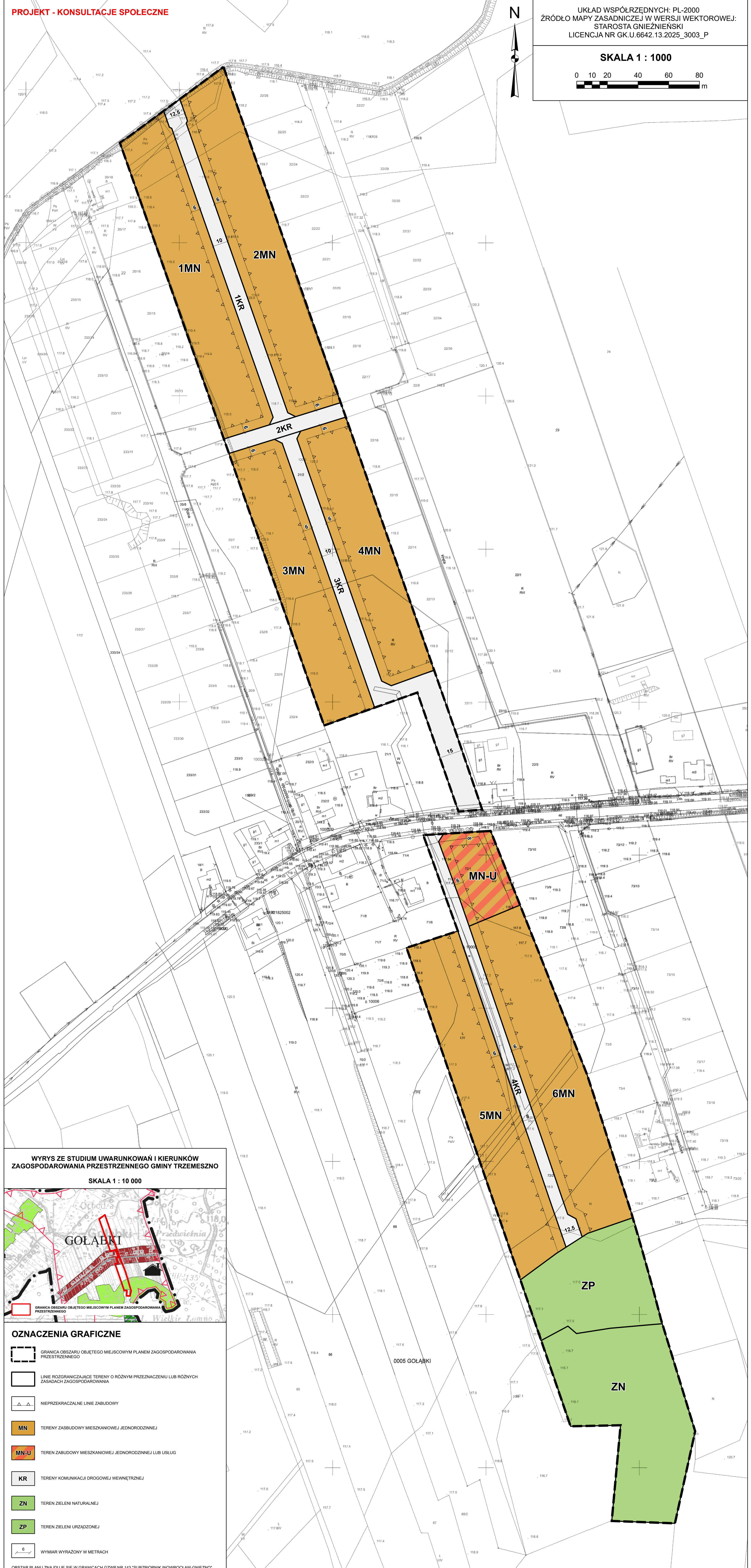
WYRYS ZE STUDIUM UWARUNKOŃ I KIERUNKÓW ZAGOSPODAROWANIA PRZESTRZENNEGO GMINY TRZEMESZNO SKALA 1 : 10 000